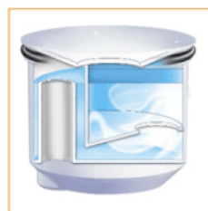
DIAGRAMS ILLUSTRATE HOW LIQUID SEALANT FLOATS ON WATER...